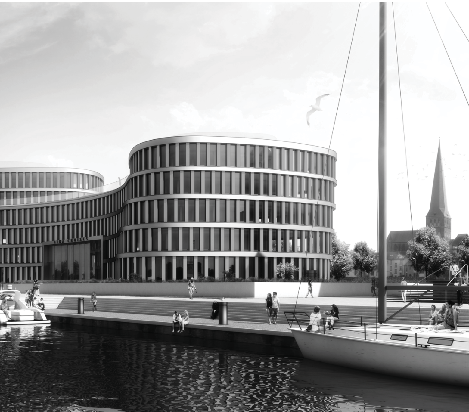
AIDA Cruises - Rostock